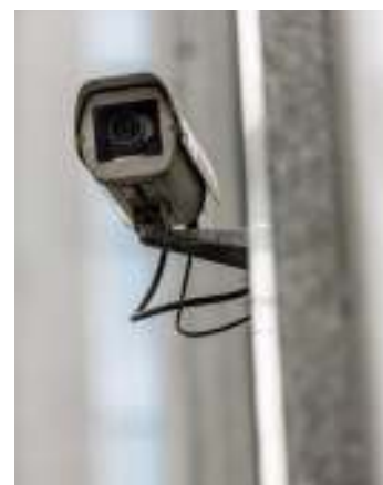
Un usage original des caméras.